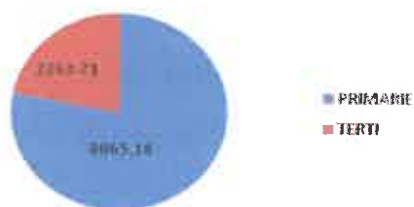
Vanzari mixturi asfaltice 2016 (to)